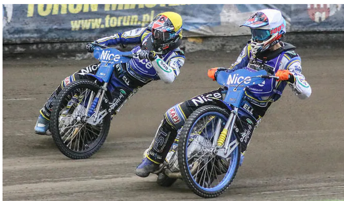
Zawodnicy rywalizujący podczas turnieju z cyklu Nice Cup